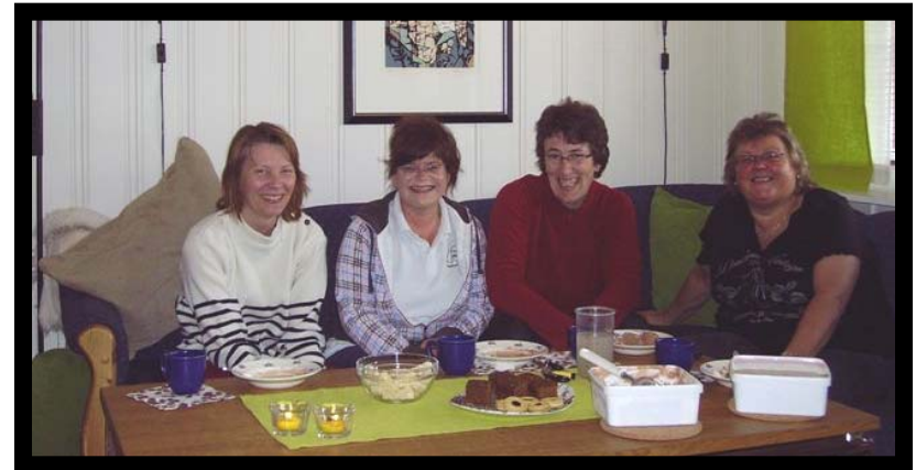
Kos på IFYE kafè på Hamar