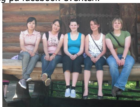
Innkommende IFYE-er 2010