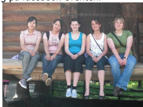
Innkommende IFYE-er 2010