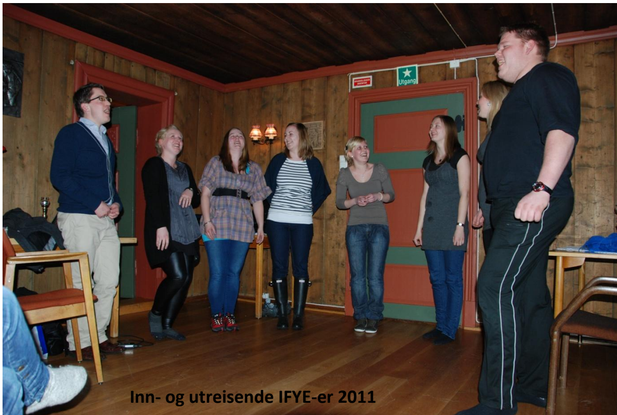
Inn- og utreisende IFYE-er 2011