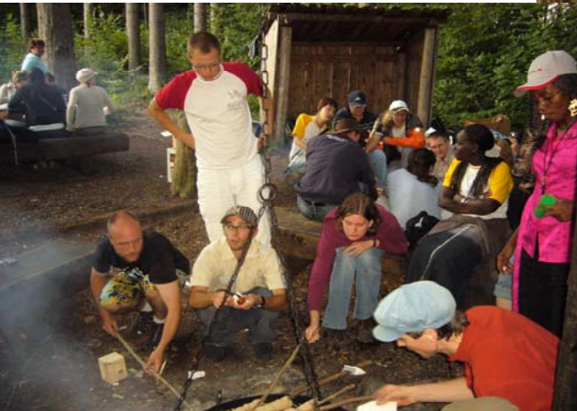
Baby IFYE`r i skogen

Verdenskonferanse Australia: 4-10 oktober 2008: http://www.ifyeoz2008.com/Conference.htm