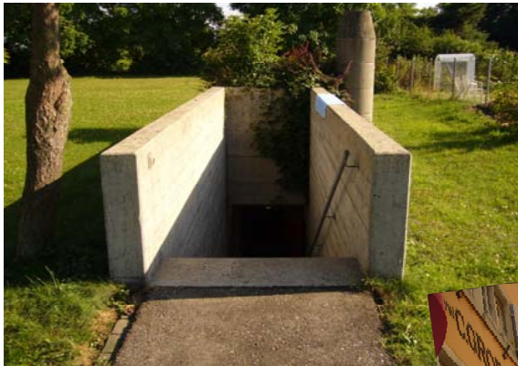
Inngang til bunkersen hvor mange flere hadde sin "hybel" under konferansen