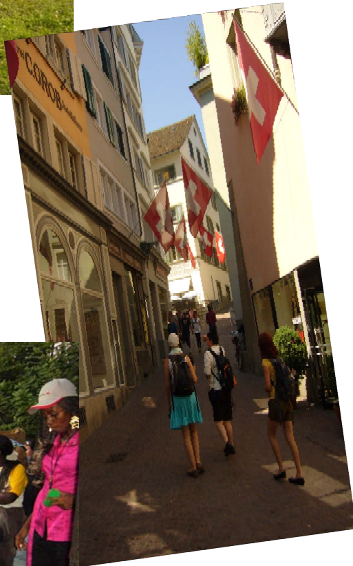
Gate i Zurich