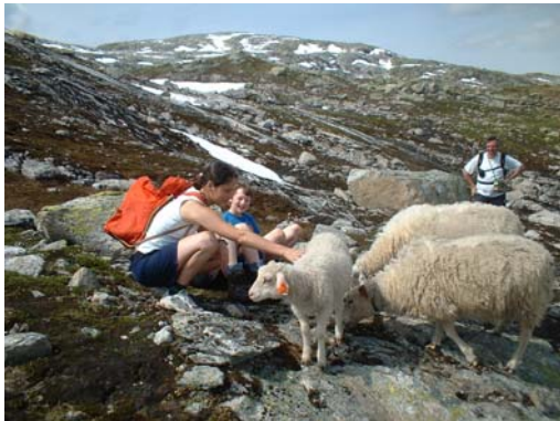
I Viksdalen, Sogn og Fjordane med 1.familie

Off course I am extremely in gratitude with 4H in Norway, with every family in Viksdalen, Gaupne, Førde, Sola, Mosterøy, Varhaug and Klepp.