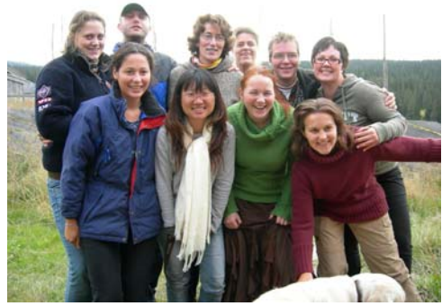
Noen av helgas IFYer samlet.