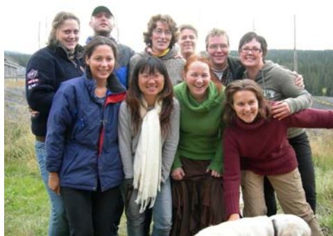
Noen av helgas IFYEr samlet.